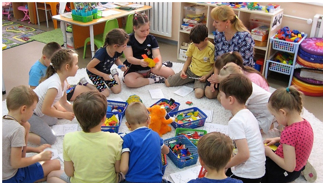
Подведение итогов дня/проекта