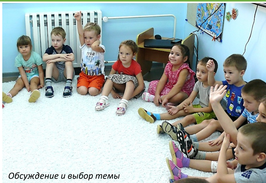
Обсуждение и выбор темы

Участвовать — значит вносить свой вклад в совместную работу, выражать свое мнение по поводу происходящего, делиться своими планами и решениями по вопросам, затрагивающим твою жизнь и жизнь группы.